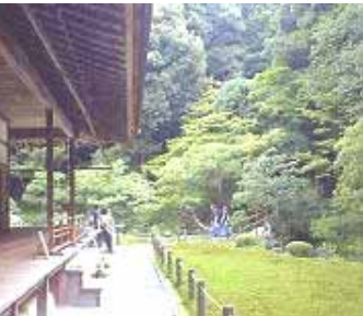
深いヒサシの日本家屋。周囲の木立や緑の庭が二次輻射を防いでくれる

この季節、カーテンやブラインド(金属製)などが窓の内側にあると日射で熱くなった熱をそのまま室内に放出することになるからかなり熱くなってしまいます。日除けを窓の内側に設けると外側とでは大きな違いがあります。簾や植栽のスクリーンで窓を日陰にするのは、理にかなった昔からの智恵である。ヨーロッパでは窓にオーニングやスクリーンを設ける。このような省エネとなるような