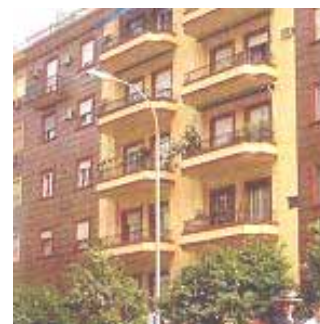
ヨーロッパの窓に多い外付けブラインド

オーニング付の窓などもっと日本で使われてもいいと思います。エコ雨戸というものがないサッシで出ていますが雨戸のレールはそのまま活用し、本体だけ交換する。雨戸は閉めていながらブラインドのようにルーバーが窓の外側で角度自在に動かさ風を入れられる。風を入れても雨戸は閉めたまま出かけられる。夜も締め切って汗だくにならず、適度にエアコンを使うようになるお勧めの省エネ部材です。