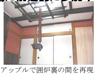
アップルで囲炉裏の間を再現

「エコの先端をいく文化を取り戻す」ビンテージリフォーム 江戸時代木材を再利用するのは当り前の時代。それがいつしか捨てる文化に変わってしまった。究極のエコはそのままの形で出来るだけ長く使う そんな私達の考えが詰まったビンテージリフォームを推進中!