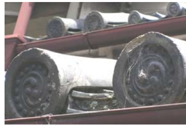
隣町の檜原市は瓦の産地 古い巴瓦の様子が美しい