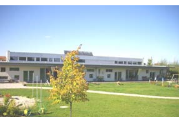
屋根上にはソーラー・コレクター(給湯+熱交換機)が搭載され給湯に活用