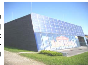
↑必要電力40%は南面のソーラー電池から ↓BIO基準の野菜でなくてもパック販売はない。

■オーストリア初のパッシブ基準(18kWh/年)のスーパー この食品スーパーはカラマツの外壁断熱木構造+省エネ窓トリプル硝子+85%熱交換機(オープン・冷蔵庫の廃熱を再利用)と自然素材で快適な室内環境を持ちます。アクティブな省エネ装置は南面ソーラー電池のみ。年間電力の40%をまかなう他は、エコ電力(風力・地熱発電)を購入し、石油エネルギーを使わないコンセプトのスーパーマーケットです。