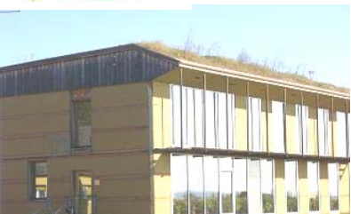
屋上緑化屋根&葦の庇で日射遮蔽