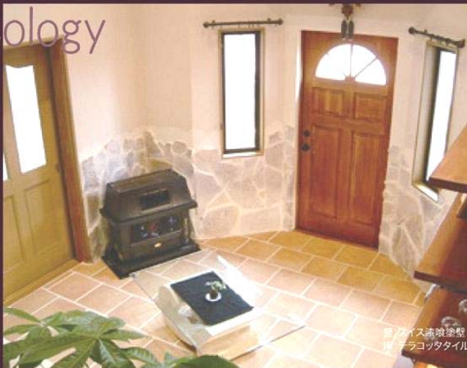
壁にスイス漆喰塗壁床にアラコッタタイル