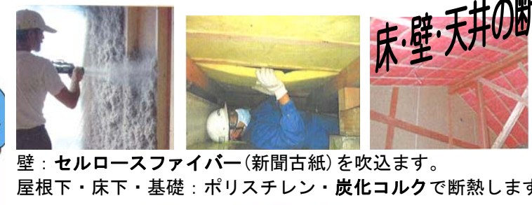
壁：セルロースファイバー(新聞古紙)を吹込みます。 屋根下・床下・基礎：ポリスチレン・炭化コルクで断熱します。