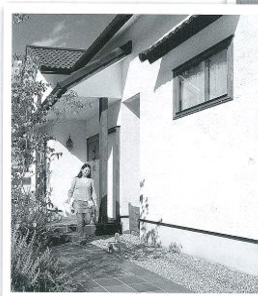
「スイス漆喰」で暮らしをみて うちにはエアコンがありません

去年の夏はとても暑かったですが、カルクウォールのおかげで部屋の中が涼しく、クーラーなしで過ごすことができています。自然体で暮らせますし、電気を使わないので環境にもいいですね。まっしろな外壁は庭のグリーンがよく映えるので、植物のお手入れも楽しくなりました。住んで2年ほど経ちますが、汚れも気にならず、自然の白のままです。カルクウォールを外壁に使うとエアコンいらすずです。