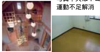
写真中央はネコ用階段 運動不足解消