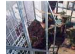
バルコニーにネコ専用緑化ルーム施工例 ストレス解消に役立っています

動物の転落事故も近年増加の傾向にあります。未然に防ぐ為にも見栄え良く手摺部分に返し又はフェンスの設置がおすすめです。